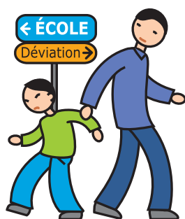
N'apprécie pas les changements