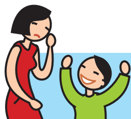
Rit de façon inappropriée