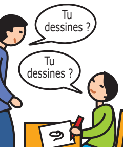
Utilise le langage de façon écholalique