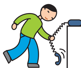
Utilise les objets de façon atypique