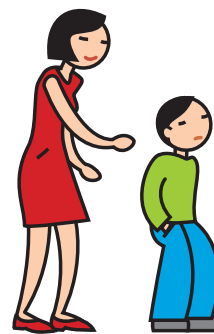
Manifeste de l'indifférence