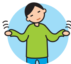
Présente des comportements bizarres